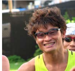
白戸 太朗 氏 （トライアスリート/スポーツナビゲーター）