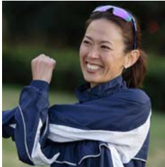
有森 裕子 氏 （五輪2大会連続メダリスト）